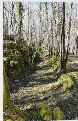
Ill.24 - « Aven du renne » ou « dépression du renne »