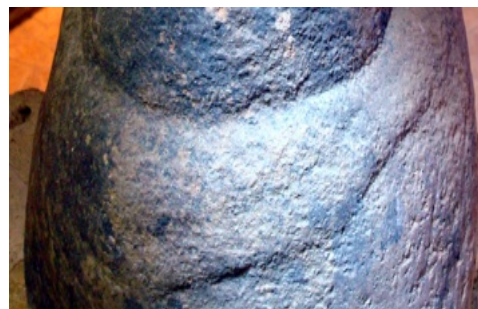
Fig.5 : Détails de la gravure des bras et des mains.