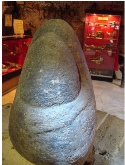
Fig. 1 : la statue dans le musée de la grotte de Saint Cirq du Bugues.

Elle évoque une « Madone », une femme sans visage, anonyme, dans laquelle chacun ou chacune pouvait se reconnaître ou y trouver une puissance supérieure non humaine. Bien entendu, rien ne nous permet d'affirmer que ce soit une femme, si ce n'est ce ventre proéminent, comme une femme enceinte. L'hypothèse est recevable.