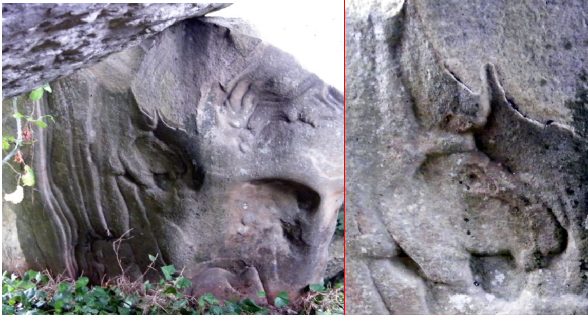
Fig. 7 :Dolmen de La Pagerie, Gennes, 49, L'orthostate en « gogotte » retouchée et détail. Tête de taureau ? De Cheval ? GPS : Lat. 47.339283 - Long. -0.25655.