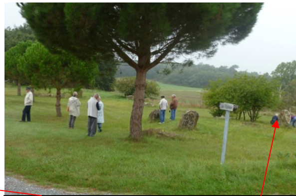
Fig. 8 : Coutures, dolmen d'Étiau. La « gogotte »