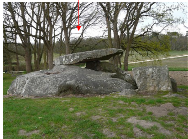
Fig. 9 : Coutures, dolmen d'Étiau, 49.