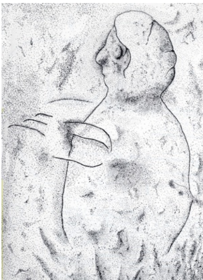
Fig. 4 : La « Vénus à la capuche » de la grotte de Gabillou, Dordogne, Magdalénien, +/- 17,000 ans.