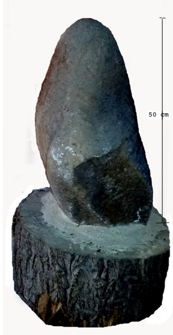
Fig. 3 : vue de dos et traces de polissage