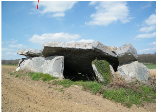
Fig.10 : dolmen de la Pagerie, Gennes, 49.