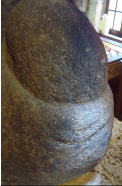
Fig.2 : La « statue menhir » de Saint Cirq, 24 (H. 50cm, l. 40cm.).

Prophylactique ? Divinatoire ? Rite de fécondité ? Germination de la terre au Néolithique ? Pour la technique et le support, nous ferons le rapprochement également avec cette énorme formation en Gogotte sacralisée dans deux monuments mégalithiques en Anjou.