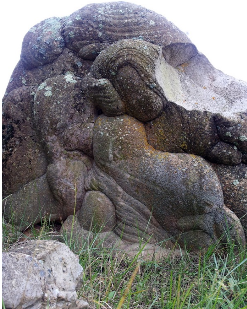
Fig. 6 : La « Gogote » près du Dolmen d'Etiau, Coutures, 49, GPS: Lat. 47.384667 - Long. -0.352333.