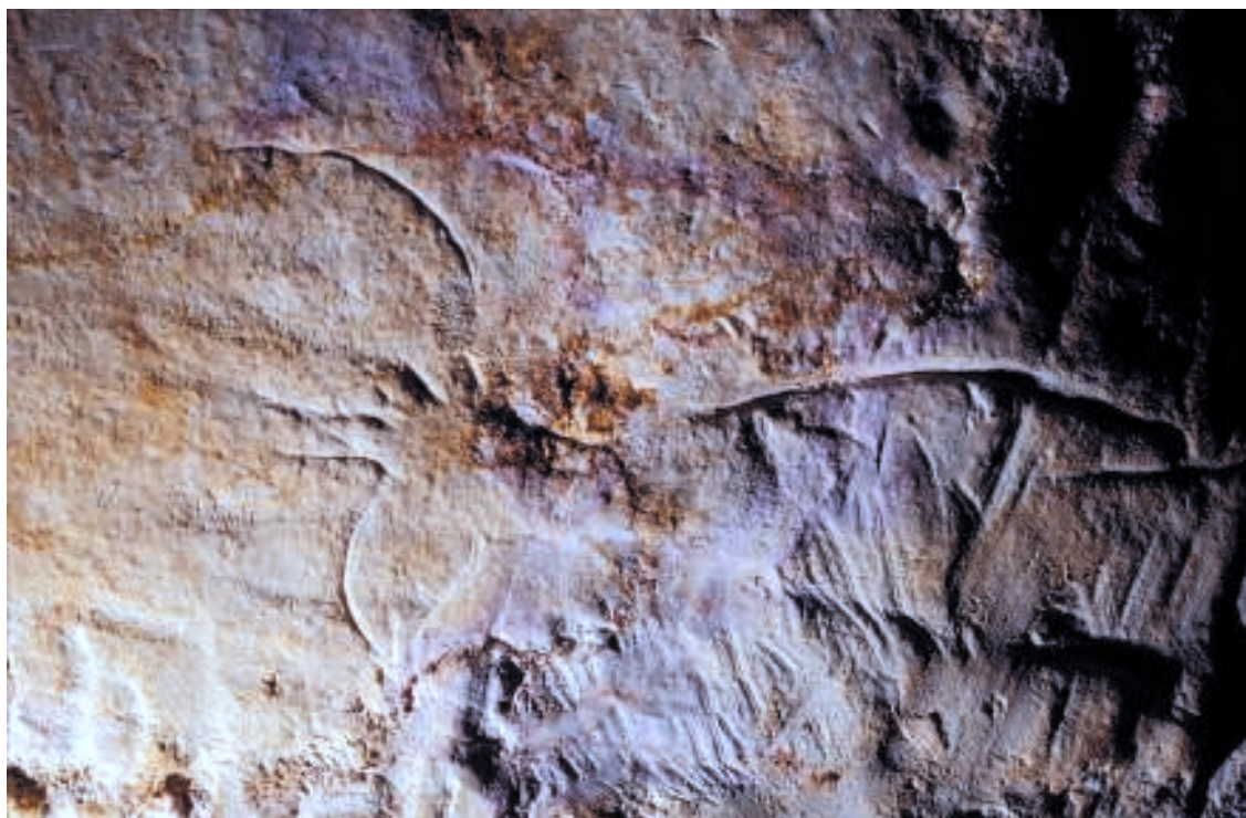
Fig. 4. Antilope saïga reconnaissable à sa tête busquée. Le trait courbe au-dessus ne fait pas partie de l'animal. Cliché J. CLOTTES.

noir. Les 29 autres animaux sont gravés. Les animaux entiers dominent nettement (19, soit 59,4 %). Un quart des caprinés et rupicaprinés (8, soit 25 %) sont affectés de signes (11 en tout) en forme de projectiles sur diverses parties du corps.