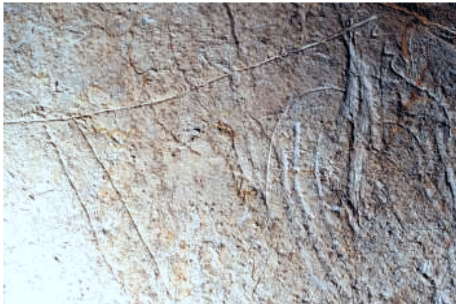
Fig. 6. Avant-train d'un animal composite à tête d'élan.

Les points, signes ubiquistes comme les barres, sont paradoxalement peu nombreux (14), qu'il s'agisse de points rouges (dans un cas, huit petites ponctuations rouges alignées deux par deux en colonne) ou noirs.