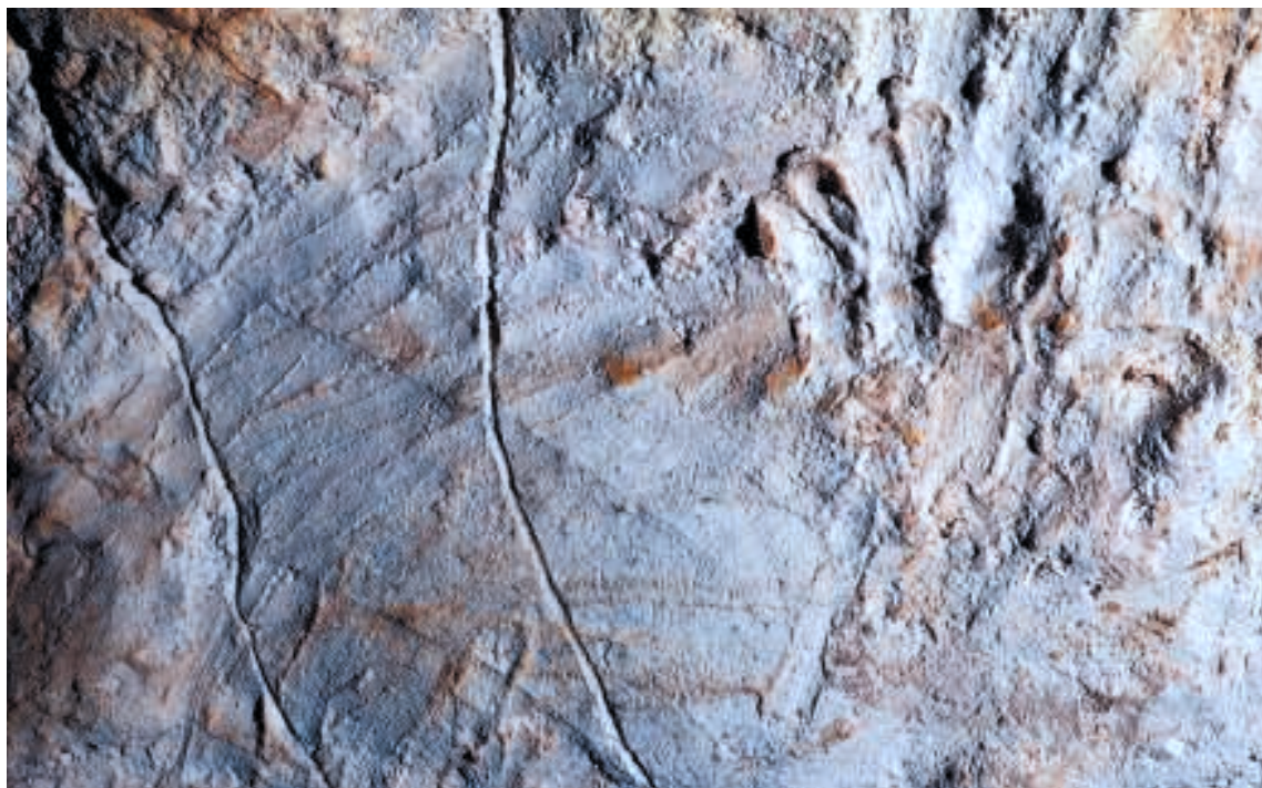
Fig. 2. La main d'enfant (11 cm) imprimée en hauteur dans la paroi. Noter les tracés digitaux et une gravure qui les surcharge.

En tout, 27 datations radiocarbone ont été réalisées. Elles ont porté sur quatre charbons récoltés sur le sol à proximité de certaines parois ornées, dans un foyer et sur douze représentations pariétales. Ces dernières comportent trois chevaux (Chv1, 5 et 7), deux bisons (Bi1 et 2), un mégacéros et un cerf, trois mains négatives (MR17, M12 et 19) et deux signes (ovale et en étoile). Les dates obtenues se répartissent en deux périodes principales bien séparées : la plus ancienne entre 29.000 et 24.000 BP, la seconde entre 19.700 et 18.000 BP, correspondant respectivement au Gravettien et au Salpêtrien (VALLADAS et al. 2005, CLOTTE et al. 1996, 1997).