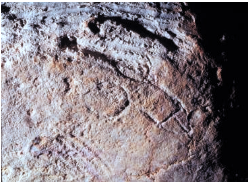
Fig. 10. Phallus gravé (L: 13 cm).