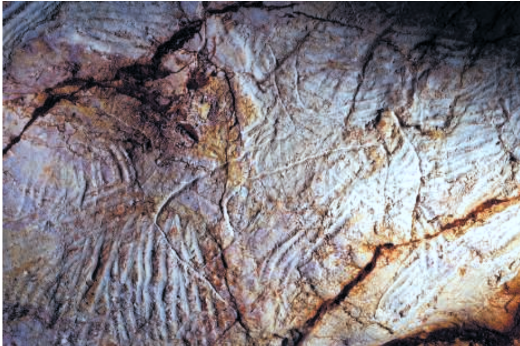
Fig. 8. Signe de type Placard.

tes de mains négatives occupent une place prépondérante (fig. 9). Leur total s'élève à présent à 65, ce qui classe le site parmi ceux qui, en Europe, en recèlent le plus grand nombre, certes loin derrière Gargas, mais à peu près à égalité avec El Castillo, qui en compterait 64. Les mains noires sont majoritaires (44, soit 67,6%) pour 21 mains rouges. Au bord du Grand Puits (secteur 205) sont exclusivement représentées les mains noires (35), dont 8 sur le seul massif stalagmitique surplombant le puits («Draperie des mains noires») et un groupe de 10 mains partiellement recoupées par le cheval gravé Chv24, groupe dit "du cheval blessé" en raison du long trait empenné et à double barbelure qui surcharge le poitrail de l'animal. Les mains gauches (43, soit 66,15%) dominent sur les droites (22). Près de la moitié des mains (29) ont des doigts incomplets, comme à Gargas. Une douzaine ont été volontairement «détruites» par incisions, raclages ou grattages. Assez curieusement, les 35 mains noires situées près du Grand Puits ne portent aucune trace de telles actions. Toutes les mains étudiées, généralement larges et robustes, appartiennent à des adultes. Certaines, présentant des doigts effilés et un poignet aux attaches graciles, pourraient être féminines. Aucune n'est attribuable à un enfant.