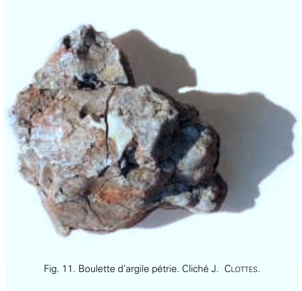
Fig. 11. Boulette d'argile pétrie. Cliché J. CLOTTE.

De très nombreuses concrétions existaient dans la grotte antérieurement aux passages paléolithiques. Les humains qui fréquentèrent ces lieux reculés s'y intéressèrent de diverses manières. Certaines, surtout des stalagmites, ont fait l'objet d'un traitement spécial, peut-être en raison de leur forme ( cf. supra , celle qui ressemble à un phallus) ou de leur emplacement, et portent de véritables dessins, animaux ou signes, ou des marquages particuliers. D'autres, plus nombreuses, ont été marquées de noir. Par exemple, dans la Salle 2, une petite stalactite en forme de sein a été dotée d'un point et de quatre traits noirs à son extrémité.