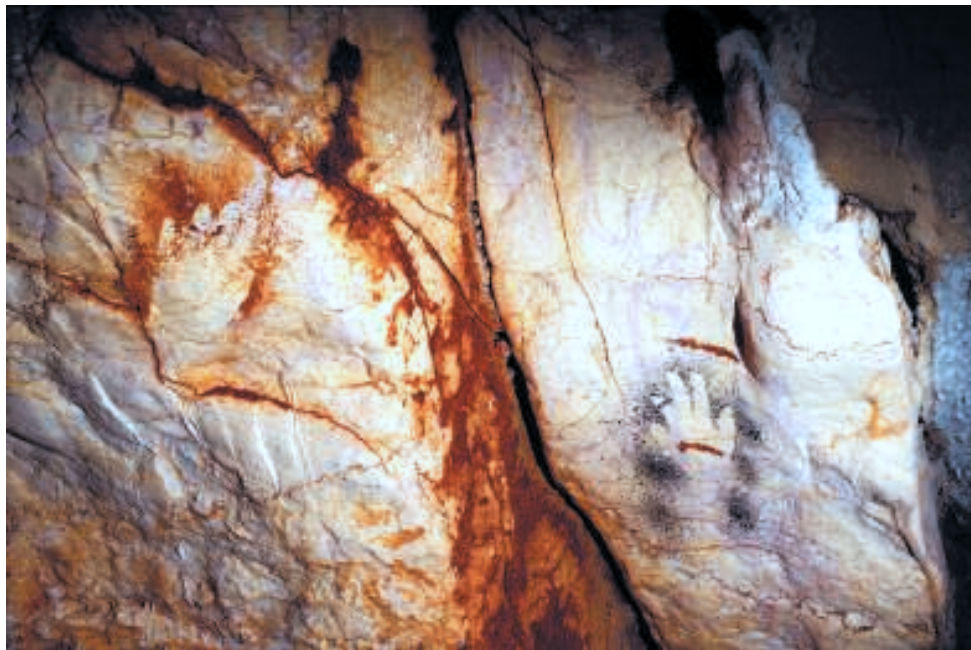
Fig. 9. Deux mains négatives, à gauche main rouge MR5, à droite main noire MR7.

sommet. Quant aux symboles sexuels féminins, présents en divers points de la grotte, ils comprennent des gravures et des dessins noirs, dont certains autour de creux naturels de la paroi.