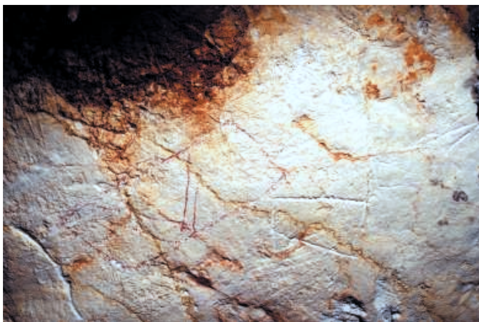
Fig. 7. Trois signes rectangulaires en forme de «valise».

Parmi les motifs humains laissés dans la grotte par les hommes du Paléolithique, les emprein-