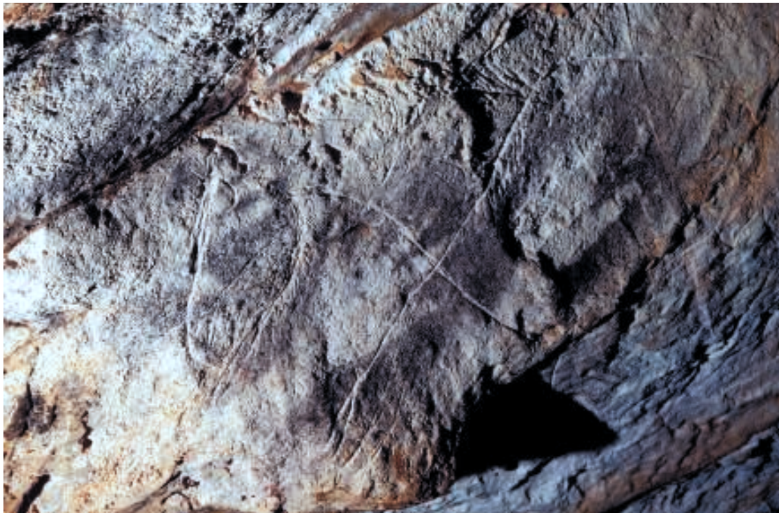
Fig. 3. Cheval gravé (Chv24) surchargé par un signe barbelé et empenné. Le cheval est superposé à trois mains négatives noires (M23, 24 et 25).

Les caprinés, rupicaprinés et antilopiné constituent le second groupe le plus important de la grotte (33, soit 18,6%), bien qu'étant près de deux fois moins nombreux que les chevaux. Outre une antilope saïga nouvellement reconnue (fig. 4), nous avons distingué 28 bouquetins et 4 chamois, en fonction de leurs cornes, celles des chamois se dressant à la verticale avant de s'évaser au sommet. Seulement 3 bouquetins sont dessinés en