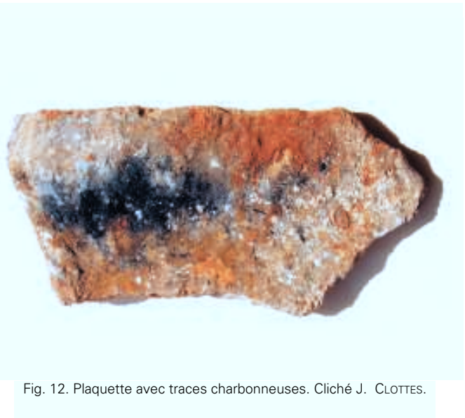
Fig. 12. Plaquette avec traces charbonneuses.