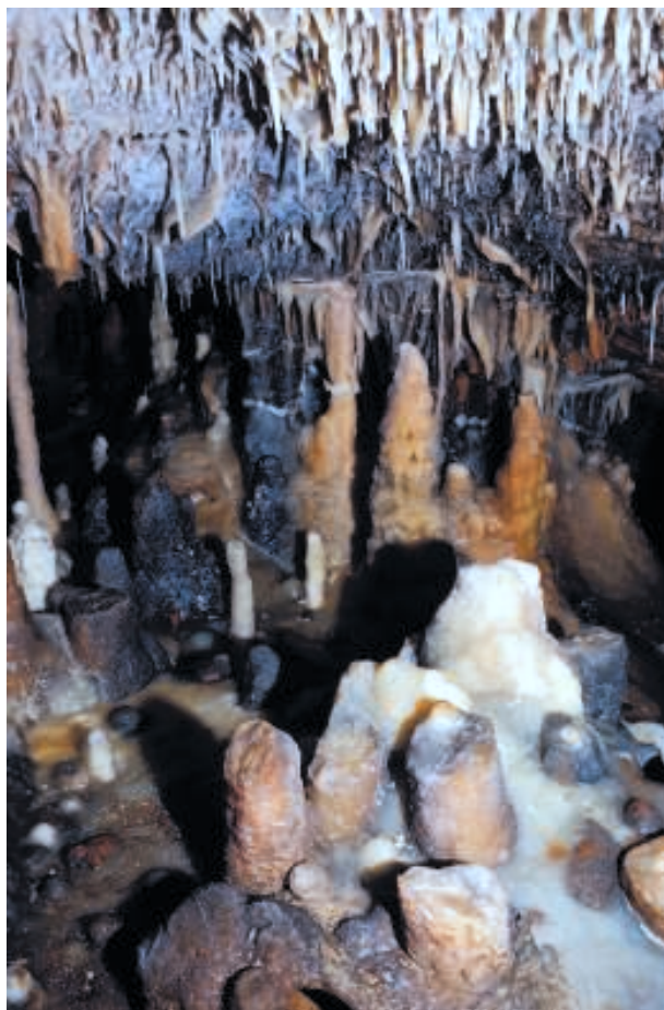
Fig. 13. Stalagmites cassées à leur sommet.

De l'argile rouge a été prélevée, comme en témoignent les nombreuses traces de doigts et de raclages. Un bon nombre de mains négatives ont