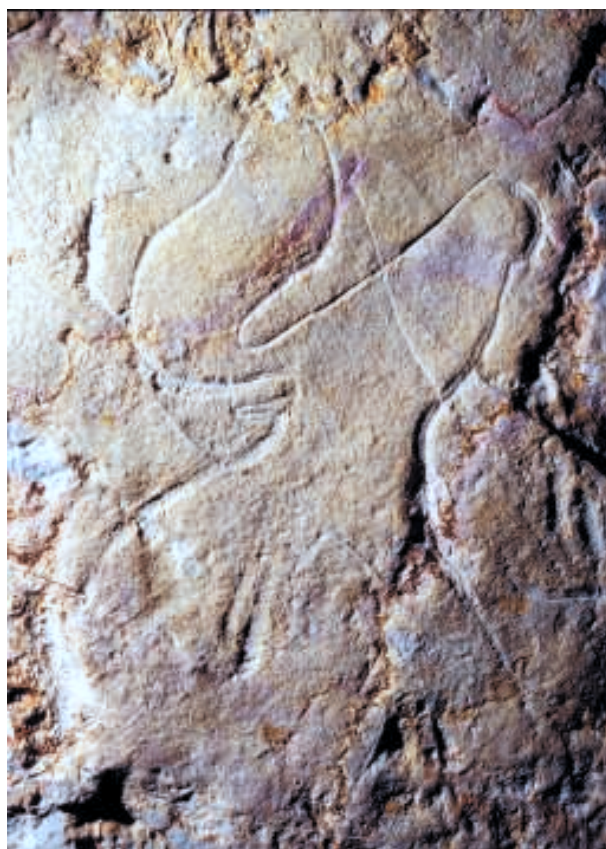
Fig. 5. Tête d'aurochs gravée (Bi10).

Parmi les cervidés (17, soit 9,6%), nous avons distingué 11 cerfs, identifiables à leurs bois, 4 biches reconnaissables à la finesse de la tête et à leur long cou et 2 cerfs mégacéros, avec leur bosse caractéristique et leurs bois démesurés. Mis à part un cerf entièrement dessiné en noir et deux